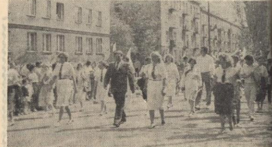
Liczną i zwartą grupę stanowili członkowie Związku Socjalistycznej Młodzieży Polskiej.