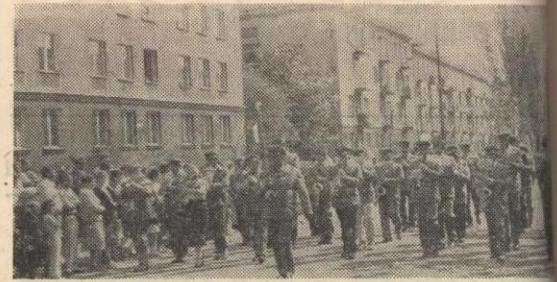
Pochód otworzyła jak zwykle orkiestra zakładowa.