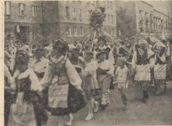
Barwny korowód szkolnych zespołów artystycznych.