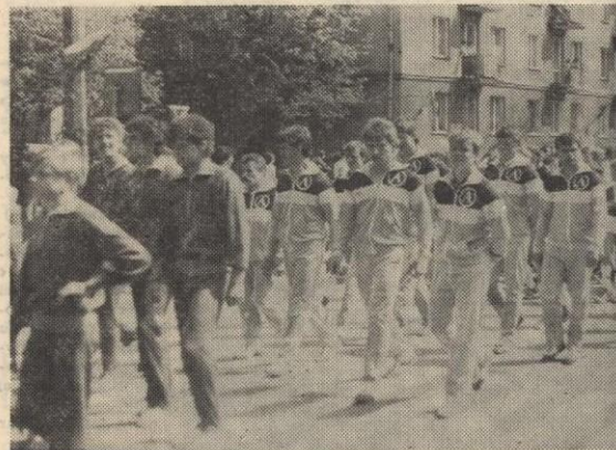
Sportowcy Avii maszerowali w galowych „dresach”.