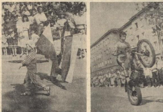
Z białoczerwoną w ręku...