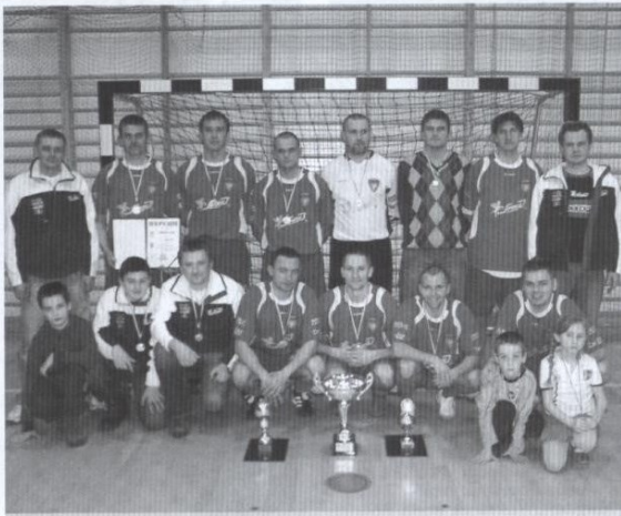
Speed Car - mistrzowie Powiatowej Zawodowej Ligi halowej piłki nożnej sezonu 2006/2007.