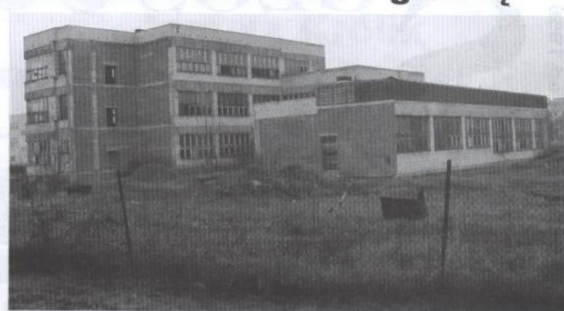
Niszczący od ponad 20 lat „dom kultury w budowie” zmieniono w nowoczesną Galerię Venus.