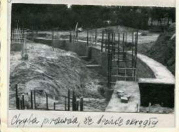
Chyba prawda, że trochę okregło