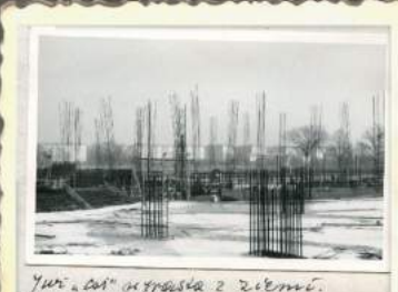
Już i coś wyrosło z ziemi.