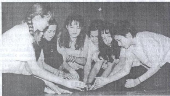
Zespół „Klan Urwisów” przedstawił pantomimę opartą na motywach powieści „Robinson Crusoe”.

jemności. Dziewczęta - bo to one głównie przychodzą na zajęcia - bardzo angażują się we wszystkie prace - wykonanie scenografii, kostiumów. Są wszechstronne. Czasem grają jednocześnie dwie, trzy role. Chętnie wcielają się w baśniowe postacie. Lubią, gdy opowieść ma elementy humorystyczne i szczęśliwie się kończy. Ja zwracam