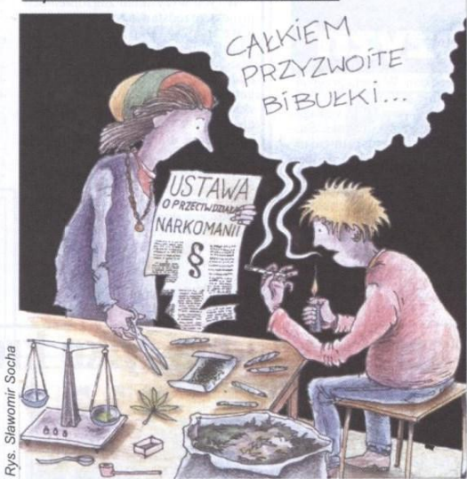
Rys. Sławomir Socha

Młodzież ocenia znowelizowaną ustawę o przeciwdziałaniu narkomanii