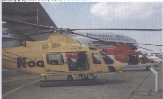
Na pierwszym planie Agusta A119 Koala, w głębi A109 Power. Kadłuby obu modeli włoskich śmigłowców będą powstawały w PZL - Świdnik.

PZL-Świdnik rozpoczynają produkcję kadłubów włoskiego śmigłowca Agusta A119 Koala. Umowę w tej sprawie podpisano 19 stycznia 2001 roku. Na jej mocy jeszcze w tym roku Świdnik dostarczy Włochom 16 kompletów kadłubów śmigłowca. Docełowo wytwórnię opuszczać będą 2 komplety miesięcznie. Wówczas PZL-Świdnik staną się jedynym dostawcą kadłubów Koali. W 2002 roku wpływy z tego tytułu powinny przynieść kwotę rzędu 1 mln dolarów.