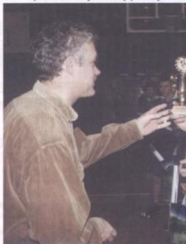
niu barażowym Blue Team 5:3.

miejsca do I ligi. Natomiast Solidarność pewnie wykorzystała swoją szansę na awans pokonując w spotka-