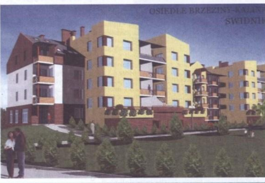
OSIEDLE BRZĘZINY - KALINA ŚWIDNIK