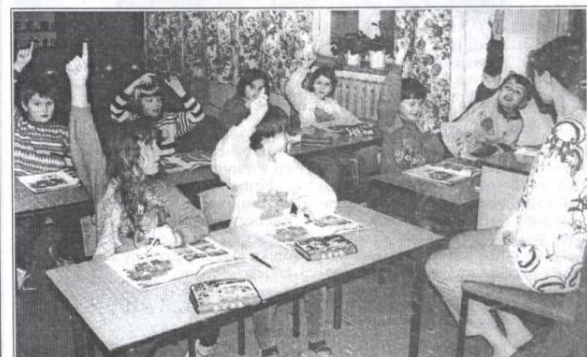
Goście z Łysakówka podczas codziennych zajęć świetlicowych w Świdnickiej Szkole Podstawowej nr 5.