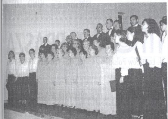
Chór „Tercja” wraz z następcą, chórem „młodym” na uroczystości 40 lecia Spółdzielni Mieszkaniowej, w kościele pw. Chrystusa Odkupiciela w Świdniku.