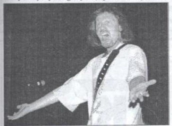
„To wasz kawalek podłogi!” - do rockowego szaleństwa namawia lider zespołu HARLEM.

dnia ustosunkował się do imprezy wokalista zespołu OFF SIDE z Lubartowa nota bene przeprowadzając swoje zwycięstwo w całej imprezie. Zespół Black Dux podzielił zdanie kolegów z Lubartowa jeżeli chodzi o poziom imprezy, lecz według nich inaczej powinna wyglądać formuła spotkania. „Jest to najlepsza tego typu impreza w regionie. Dla takiego zespołu jak my to jedyna okazja na pokazanie się, ale jury w którym zasiada pianista, czy organista, to zapowiada się źle. Cóż zobaczymy, a poza tym nie odpowiada mi cały ten wyścig po nagrody. Powinno być przegląd bez nagród. Wtedy wszyscy mogliby się spotkać i wymienić