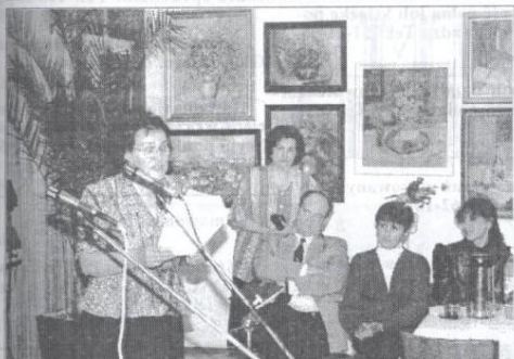
Dokonania artystów ocenili w swych utworach poeci z Grupy Poetyckiej „VENA”.