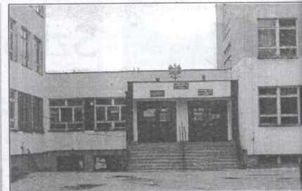
Szkoła Podstawowa nr 4 im. Władysława Sikorskiego Dyrektor - Ryszard Borowiec