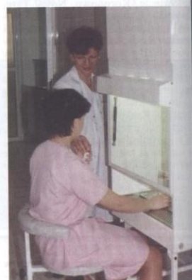
tychczasową działalność ZOZ-u we wdrażaniu reformy podstawowej opie-ki medycznej.