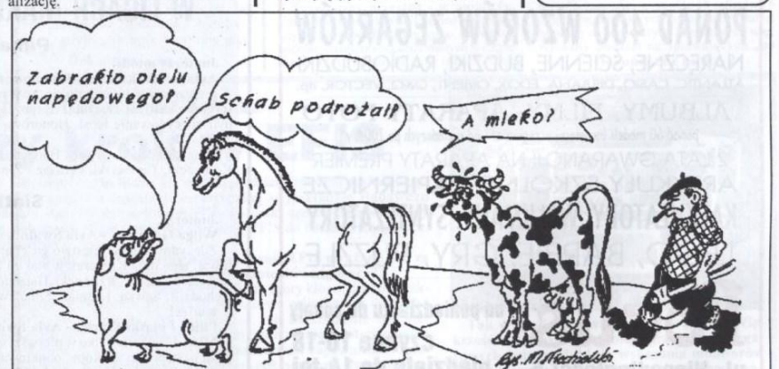
Polska po trzech latach rządów koalicji SLD - PSL...

Kierownicy rejonowych urzędów pracy są natomiast skrupulatnie rozliczani z „walki z bezrobotnymi z prawem do zasiłku”, zaś nie wywiązujący się z zaleceń są karani.