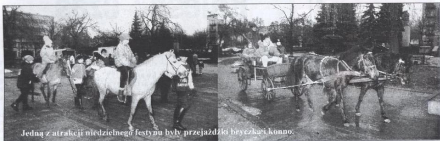
Jedną z atrakcji niedzielnego festynu były przejażdżki bryczką i konno.