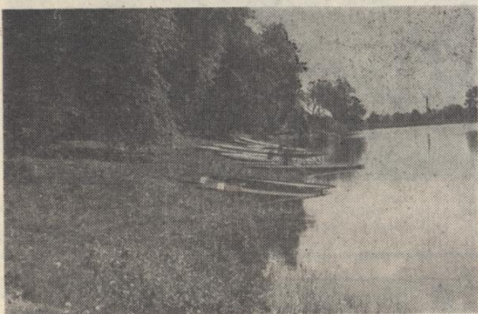
W ośrodkach wypoczynkowych jeszcze zimno i pusto.

Wypoczywając odwiedzać będą z pewnością cafe — „Błękitna”. Wnętrze kawiarni zostało zmoderinizowane. Dzieci doczekają się wreszcie brodzika i placu zabaw. W sumie w ośrodku sporo nowości, a i ceny biletów także zmniejszone. Bilet wstępu na otwartą pływalnię kosztuje 10 tys. złotych (normalny) i 5 tys. zł (ulgowy).