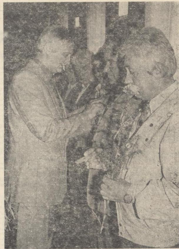
Z okazji Święta Lotnictwa zasłużonemu pracownikowi WSK wręczono odznaczenia resortowe i zakładowe.

Przypominamy, że na poprzednim zebraniu, na którym również dyskutowano nad przyszłością solidarnościowego Komitetu — który kilka miesięcy temu wygrał wszystko, co było do wygrania w wyborach samorządowych — pojawiło się kilka opinii na temat tego, czym Komitet powinien być w nowych warunkach. Zdaniem części działaczy Komitet stracił rację bytu, inni chcieliby go utrzymać w zmienionej formie.