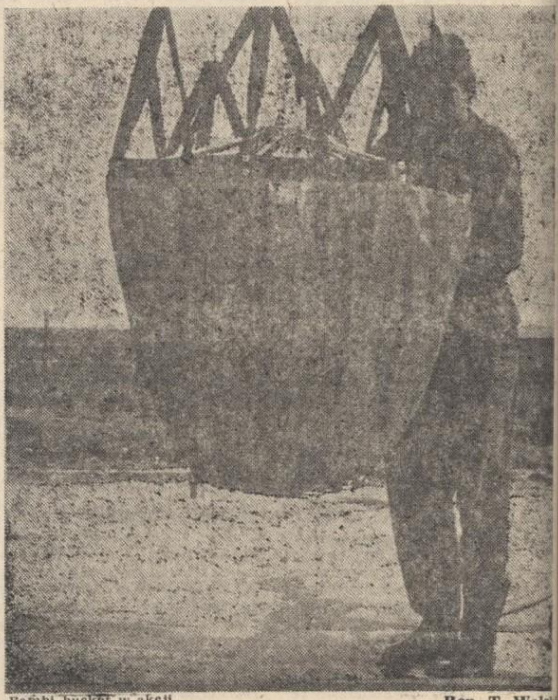
Bałbi bucket w akcji.