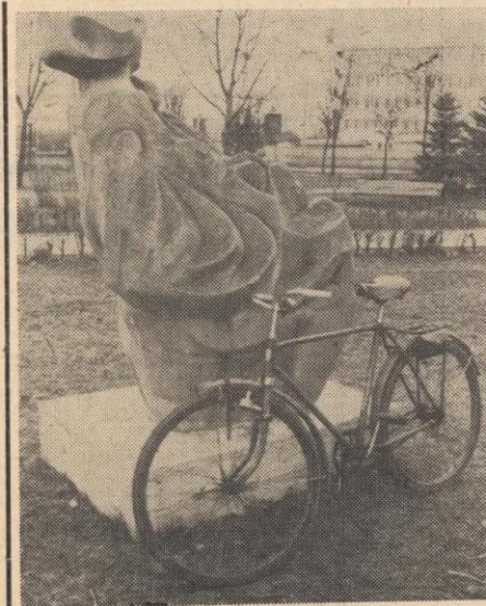
...a był tacy, którzy mówili, że świdnickie rzeźby są niepotrzebne.

W ramach porządków wiosennych, MPGKiM na administrowanych przez siebie domach dowiesiło po jednej, niestaramie wykonanej tabliczce z numerem budynku. Wygląda na to, że w tym, skądinąd solidnym przedsiębiorstwie, jak kilka osób, które z braku innego zajęcia zajmują się „radosną twórczością”.